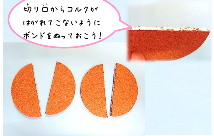
線の通り半分にする