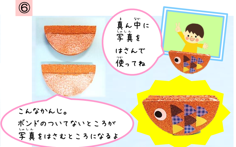
線の下だけにボンドをつけて貼り合わせたら完成!