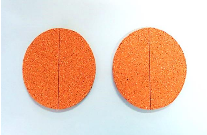
コルクコースターの中心に線を引く