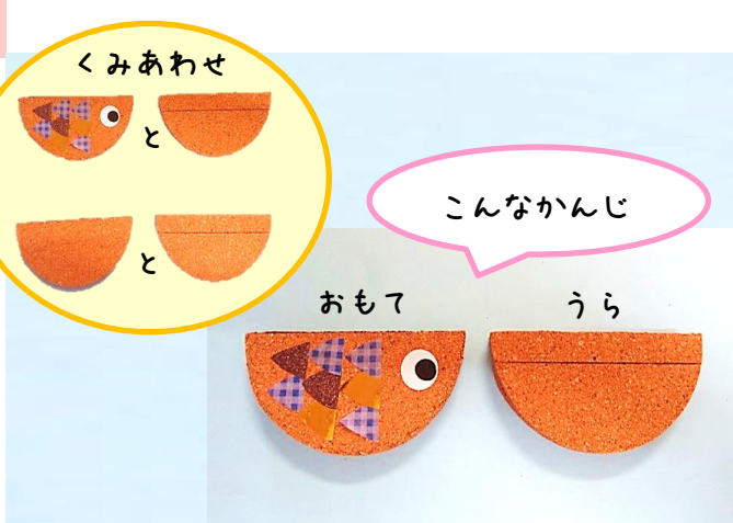
④の半円とそれ以外のものので2枚ずつ貼り合わせる